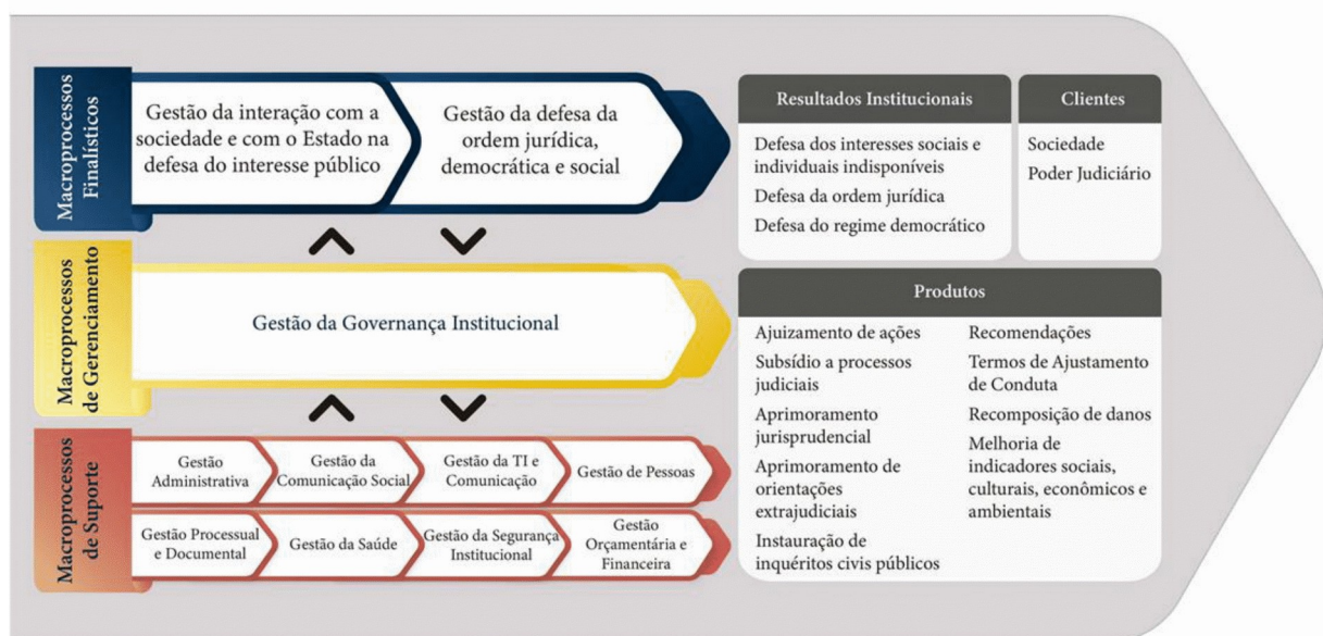
Figura 3 – Cadeia de Valor do Ministério Público Federal

Percebe-se, portanto, a importância que a instituição confere ao tema ao incluir, entre seus valores, a transparência e a ética. Dessa forma, afirma e registra serem itens que o MPF acredita e deseja ver compartilhados entre aqueles que trabalham na organização.