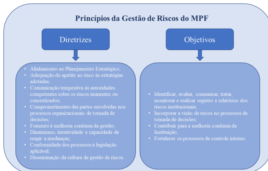
Quadro 1 - Princípios da Gestão de Riscos

Já a estrutura de gestão de riscos é a maneira como a entidade se organiza para gerenciar os riscos institucionais. Seu propósito é apoiar a organização na implementação da gestão de riscos, integrando-a aos processos de governança e de gestão e consolidando-a como cultura organizacional.