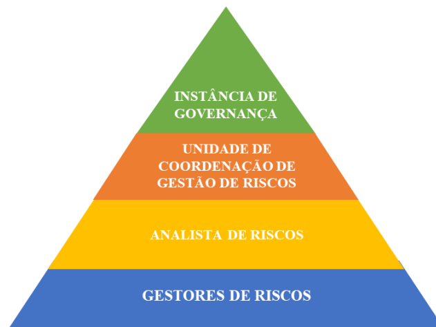
Figura 1: Dimensões da estrutura de governança de gestão de riscos do MPF

A gestão de riscos do MPF compreende as dimensões de governança e de gestão, conforme abaixo: