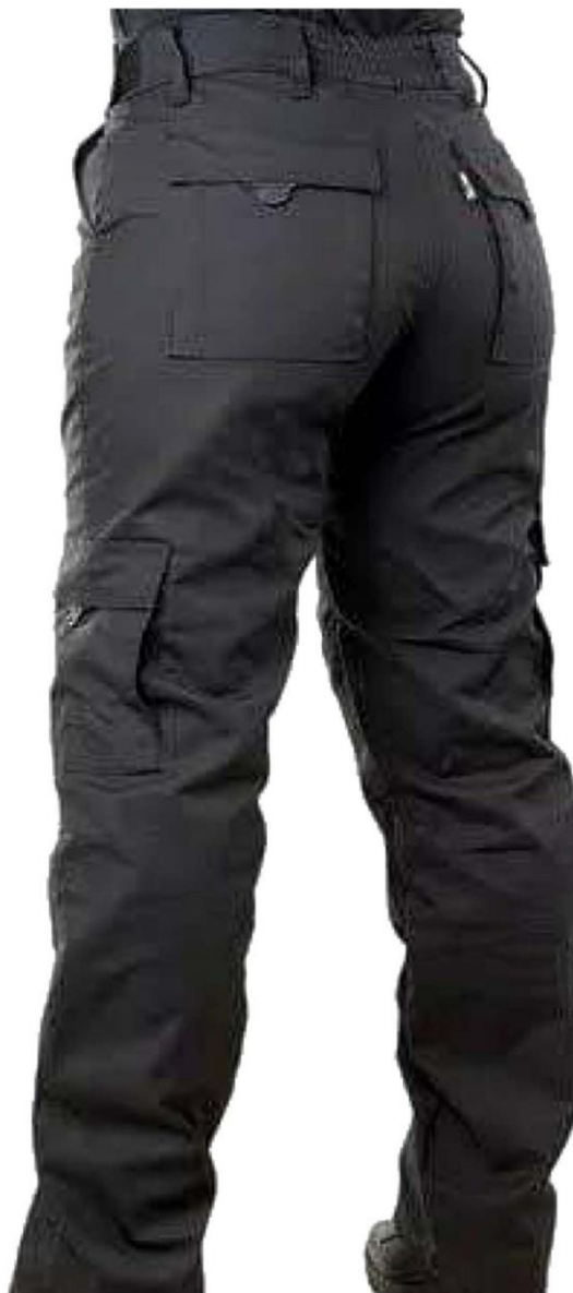
Calça Tática Feminina –Verso