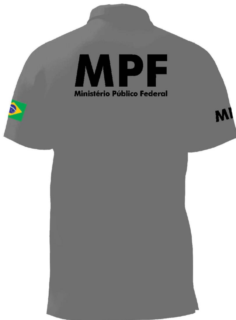
Camisa Polo para Ambos Gêneros - Costas