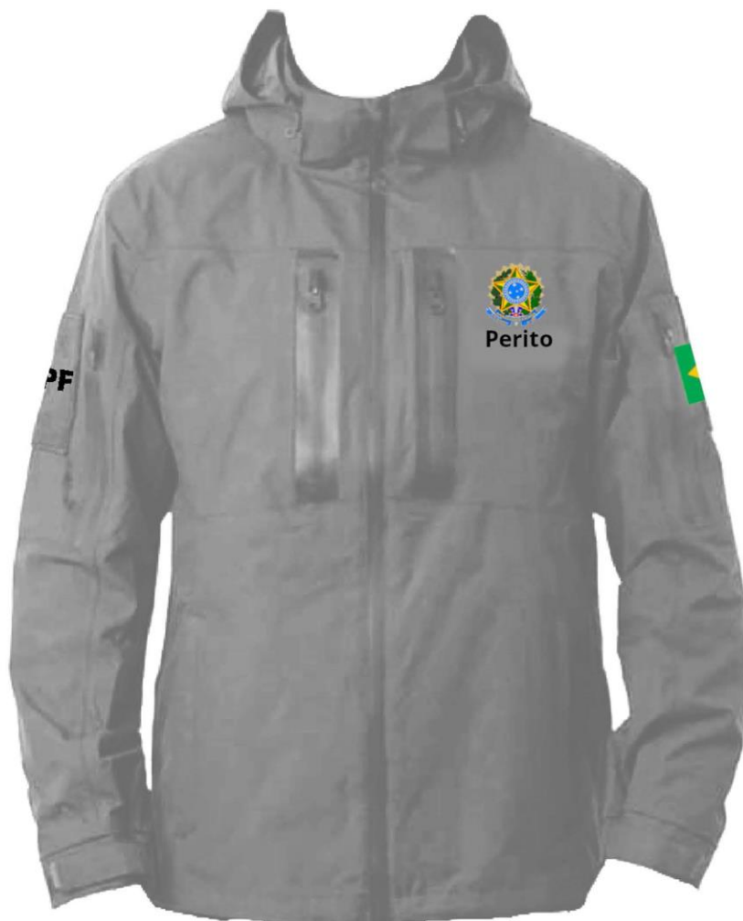
Jaqueta para Ambos Gêneros