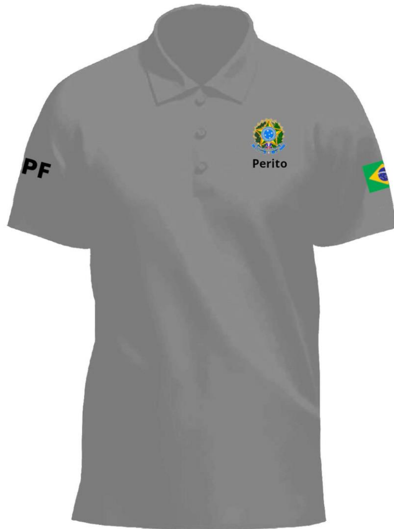
Camisa Polo para Ambos Gêneros - Frente