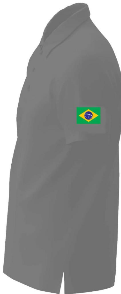
Camisa Polo para Ambos Gêneros – Lateral esquerda