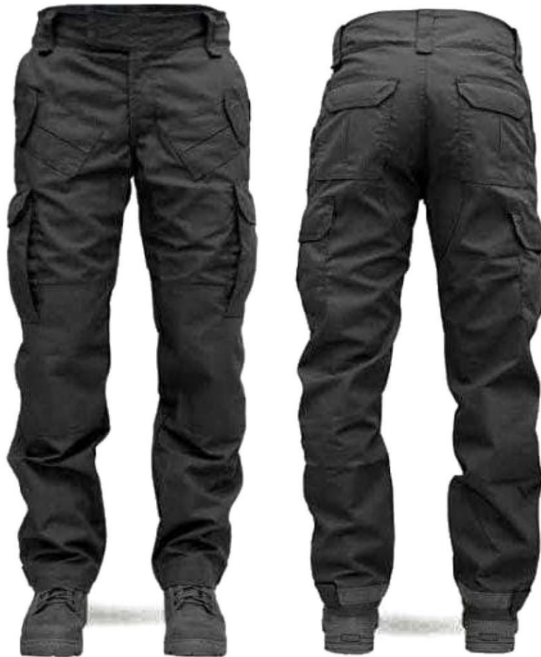
Calça Tática Masculina – Frente e verso