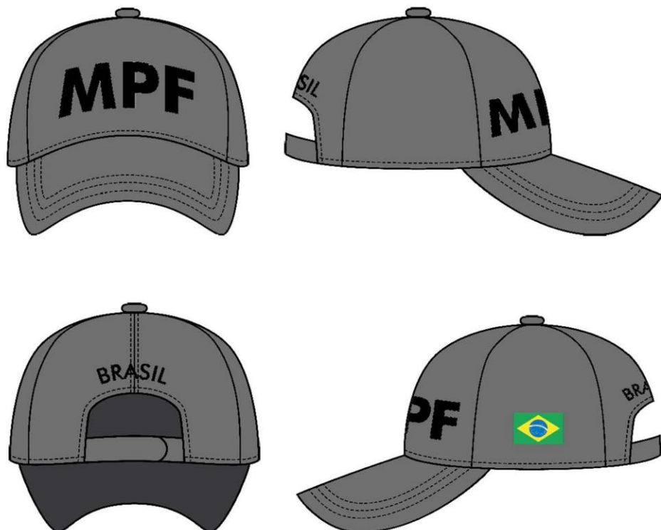
Boné para Ambos Gêneros