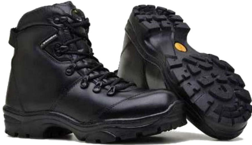
Bota Tática para Ambos Gêneros