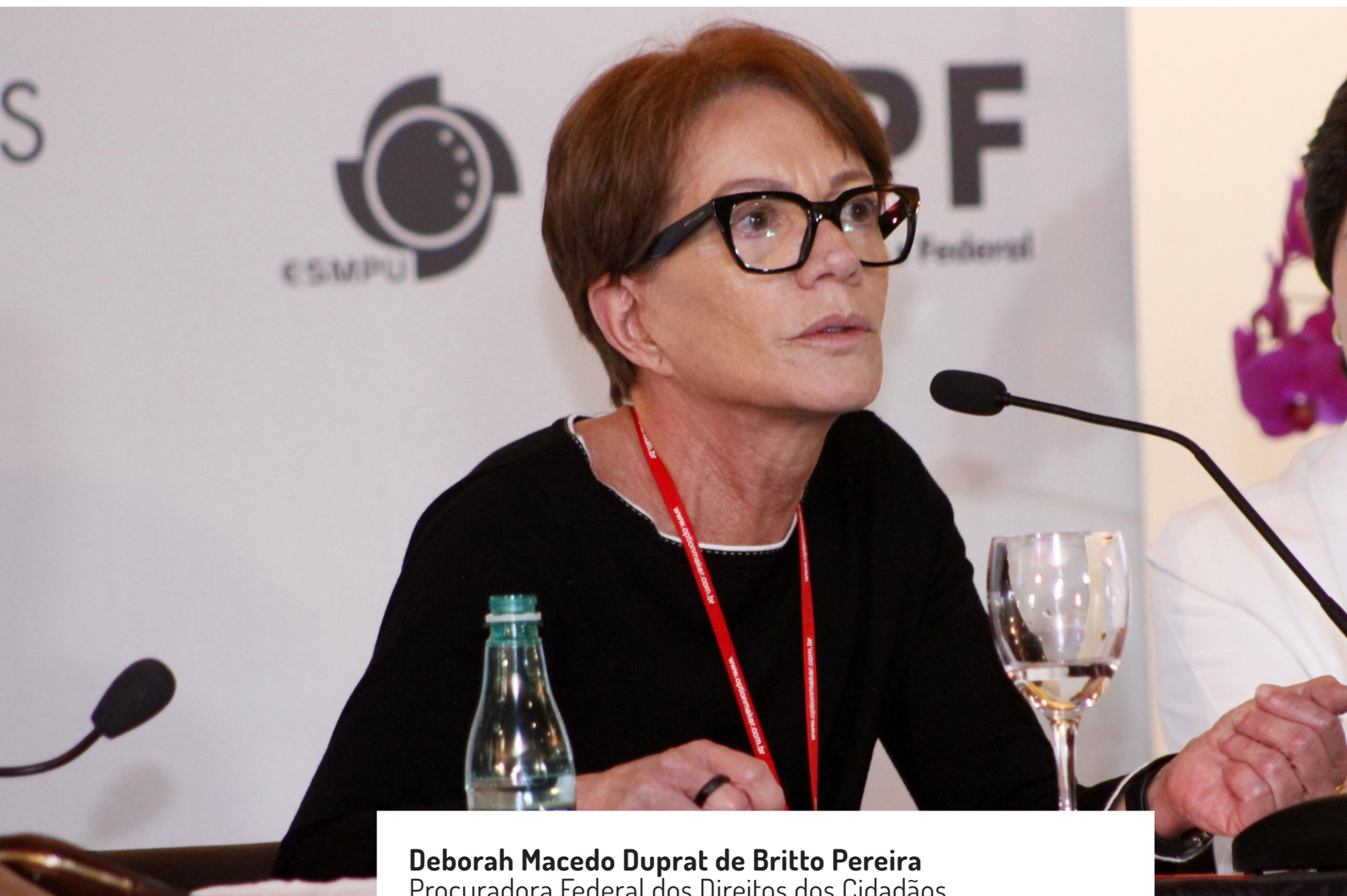
Deborah Macedo Duprat de Britto Pereira Procuradora Federal dos Direitos dos Cidadãos

“Uma das características de ser mulher é aproveitar espaços e oportunidades que temos e construirmos espaços de reflexão, como essa Conferência. É importante nós pensarmos como a nossa instituição estrutura as relações de gênero. Nós não temos como negar o patriarcado. Ele nos vem desde a ágora grega, em que o espaço das decisões públicas é um espaço masculino, e o espaço da mulher é o espaço doméstico, o que continua ocorrendo na modernidade. Relações de dominação só são possíveis porque elas são tecidas numa rede de invisibilidade. Então, é absolutamente indispensável que a gente se reúna, em um primeiro momento só mulheres, para que estejamos juntas, livres de quaisquer amarras para nos manifestar. Posteriormente, torna-se necessário envolver os homens nessa discussão. Não é pretensão de nenhuma de nós estabelecermos uma eterna competição entre homens e mulheres, mas construir um Ministério Público livre de dominações. Eu acredito que nós somos capazes, sim, de termos uma instituição mais igual. ”