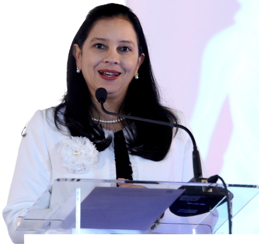
Grace Mendonça Advogada-Geral da União

“ Se queremos igualar, é de fundamental importância que paremos para nos dedicar ao enfrentamento desses desafios. Numa certa oportunidade, uma pessoa muito sábia disse, para minha surpresa: a vaidade da mulher está no batom e no esmalte e a vaidade do homem está no poder. Essa frase me chamou a atenção porque, apesar de não podermos generalizar, o fato é que nós precisamos parar e refletir um pouco acerca desses espaços de poder e em que medida está justa a relação de ocupação desses postos pelas mulheres. Nós já sabemos que o Brasil vem, de alguma forma, enfrentando essa pauta. Sabemos que hoje temos uma formação muito peculiar no poder – ministra Cármem Lúcia como chefe do Poder Judiciário, Raquel Dodge como procuradora-geral da República. Sabemos que esses enfrentamentos, esses temas estão muito bem tratados também pelo Poder Legislativo brasileiro, mas ainda temos muito a avançar. ”