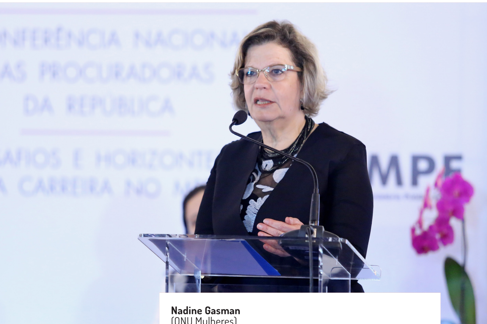
Nadine Gasman (ONU Mulheres)

“ Estamos obstinados em transformar o mundo, numa caminhada até 2030 para atingir os Objetivos de Desenvolvimento Sustentável, para construir um planeta 50/50. Isso quer dizer um planeta igualitário, um planeta equitativo, onde mulheres e homens tenham os mesmos direitos, oportunidades e responsabilidades. É um caminho que tem que ser construído em todos os âmbitos, e o da Justiça é especialmente importante. Sabemos que temos 30% de mulheres no Ministério Público Federal. O Comitê Gestor de Gênero e Raça é uma instância fundamental para pensar a equidade de gênero e de raça, e, por isso gostaria de fazer uma recomendação, com muita humildade, para que sejam criadas essas comissões nas unidades estaduais e regionais do MPF. Não basta só chegar a postos de liderança, é muito importante refletir e reformar o que tem que ser reformado para que o caminho das quem vêm depois de todas nós seja muito mais fácil. ”