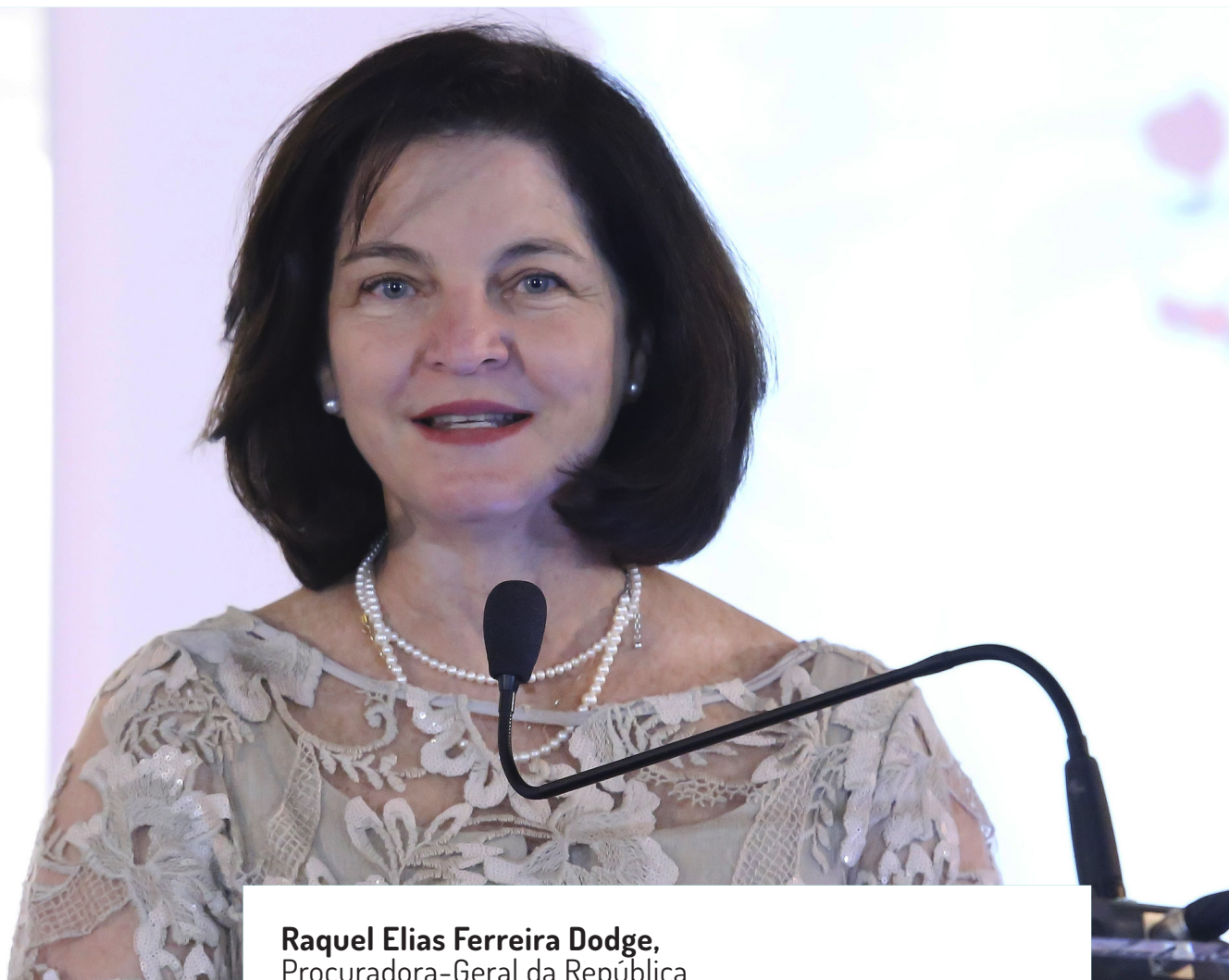
Raquel Elias Ferreira Dodge, Procuradora-Geral da República

“Estou feliz e honrada por receber e contar com a contribuição, nesta I Conferência Nacional das Procuradoras da República, de estimadas e brilhantes mulheres, que têm contribuído para assegurar a participação feminina na vida pública e para avançar o debate sobre equidade de gênero no Brasil e no mundo. Parece-me adequado dizer que todas são pioneiras e desbravadoras, porque esta é uma jornada em curso e ainda falta muito para que se complete a plena e paritária participação feminina em todas as relações sociais. Esta é uma conferência das procuradoras da República, mas o tema é comum a todas as mulheres, tanto as que oficiam na vida privada quanto as que participam da vida pública. Em qualquer povo e país, as mulheres têm um papel fundamental no ensino da língua, na educação dos filhos, na transmissão de valores, na alimentação humana, na criação de ambientes de paz, na cultura do diálogo e na religiosidade. Compartilham também de sofrimento e do tratamento discriminatório, às vezes violento; preconceituoso, às vezes mutilador; desrespeitoso, às vezes assediador; restritivo, a ponto de necessitar de ações afirmativas. Há muito a avançar.