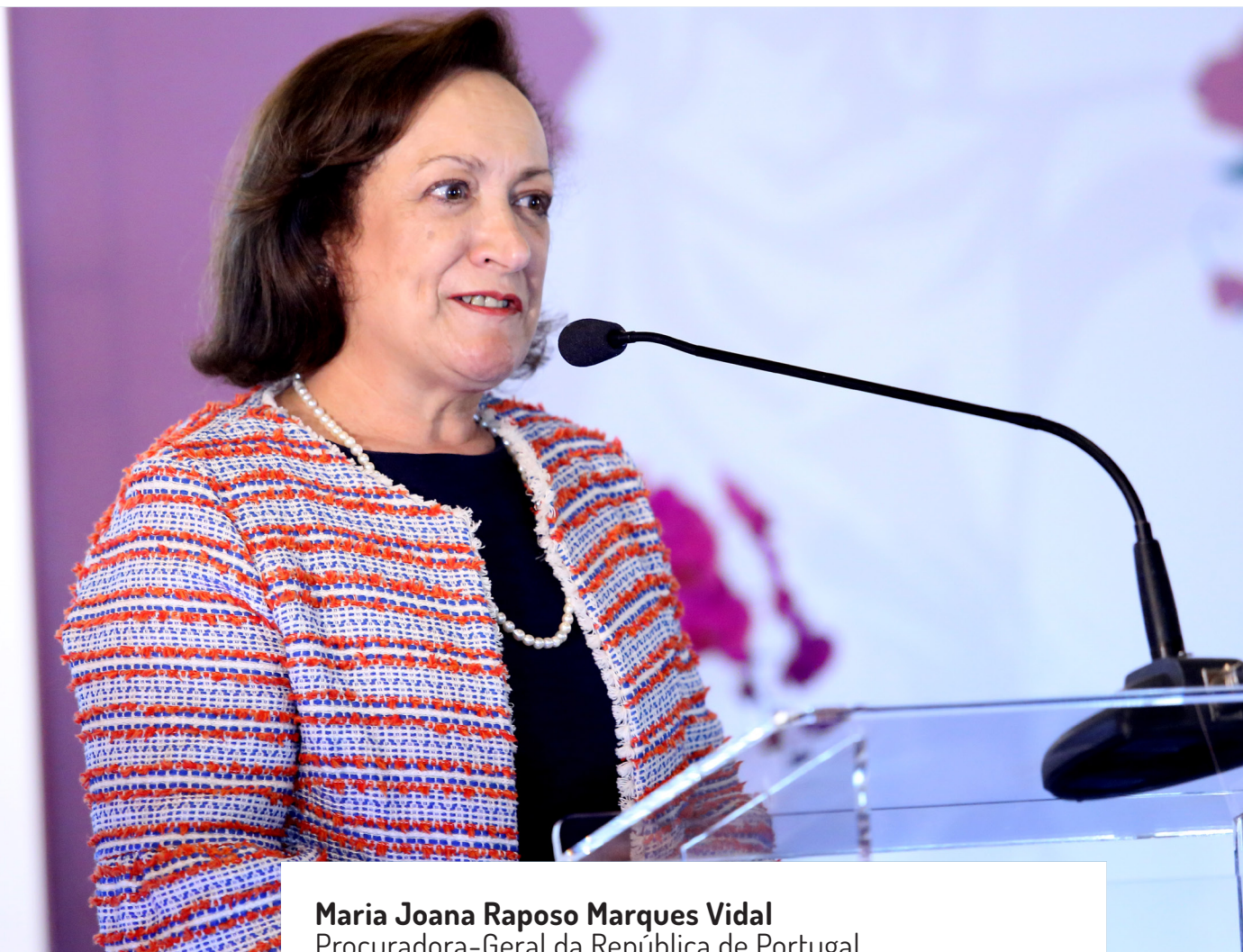
Maria Joana Raposo Marques Vidal Procuradora-Geral da República de Portugal

“ Durante muitos anos, as mulheres estiveram em situação de discriminação. Em Portugal, há 40 anos, as mulheres tinham que pedir autorização para abrir um negócio. Elas precisavam de autorização do Estado para se casar. Os filhos pertenciam, principalmente, aos pais, e as mulheres não podiam ser embaixadoras, magistradas ou militares. Atualmente, 60% dos magistrados do Ministério Público são mulheres, as juízas ocupam 50% das vagas do Judiciário, há muitas diplomatas, há mulheres militares. Apesar de tudo, estudos recentes dizem que Portugal é o segundo país em que a desigualdade de pagamento, de homens e mulheres que exercem a mesma função, é mais profunda, alargada. Por isso, ainda temos muito que caminhar. É necessária uma profunda confiança em si mesmas, nas nossas capacidades, competências, conhecimentos e poderes. Homens e mulheres precisam se preocupar com essa questão. O mais importante é atingir na prática a mudança cultural, e encontros como esse são essenciais para que isso corra. ”