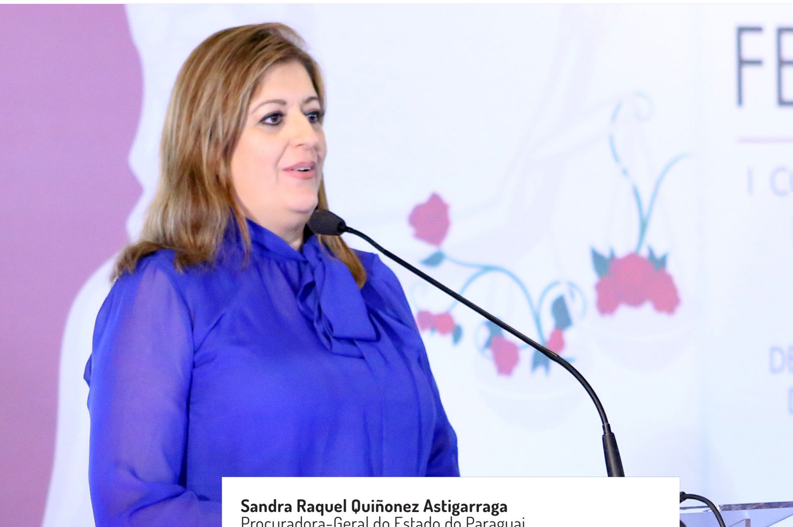
Sandra Raquel Quiñonez Astigarraga Procuradora-Geral do Estado do Paraguai

“Sou a primeira mulher a assumir o cargo procuradora-geral do Estado do Paraguai. Assumi há três meses e há muita expectativa em relação a mim, tendo em vista a importância do cargo. É um grande desafio e meu compromisso é lutar contra o crime organizado, a corrupção e o terrorismo. Não deve haver fronteiras para a luta contra o crime internacional. A certeza é de que o MP do Paraguai está de portas abertas.”