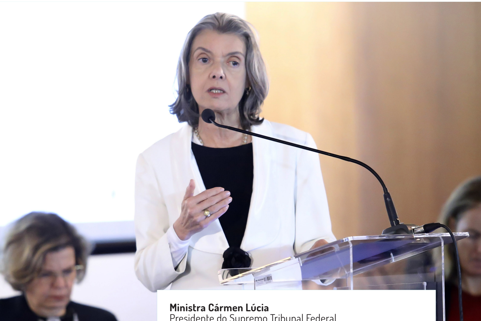
Ministra Cármen Lúcia Presidente do Supremo Tribunal Federal

“ A Constituição Brasileira, que este ano completa 30 anos no dia 5 de outubro, trouxe como o princípio mais repetido no seu texto o princípio da igualdade. Passados 30 anos, continuamos a ter como um dos principais – se não o principal problema brasileiro – a questão da desigualdade. Por isso, o princípio da igualdade não é apenas mencionado, mas repetido expressamente como nenhum outro princípio é assim repetido na Constituição Brasileira. E tão grave era o quadro encontrado pelos constituintes de 1987 e 1988, que no caso específico do gênero não foi suficiente expor o que as outras constituições estabeleciam: “todos são iguais perante a lei sem distinção de qualquer natureza”. Foi necessário ir além e expressar claramente, e em seguida expressou: “homens e mulheres são iguais em direitos e obrigações, nos termos desta Constituição”. Isso porque a desigualdade em relação à mulher, o preconceito em relação à mulher tão forte era, e continua sendo, que o constituinte viu por bem tornar isso expresso e não apenas deixar que a questão de gênero ficasse na expressão maior do princípio da igualdade. As desigualdades são muitas, os preconceitos são muitos, eram muitos e continuam sendo. É, portanto, com enorme satisfação que eu vejo iniciativas como essa de promover a I Conferência Nacional das Procuradoras da República. ”