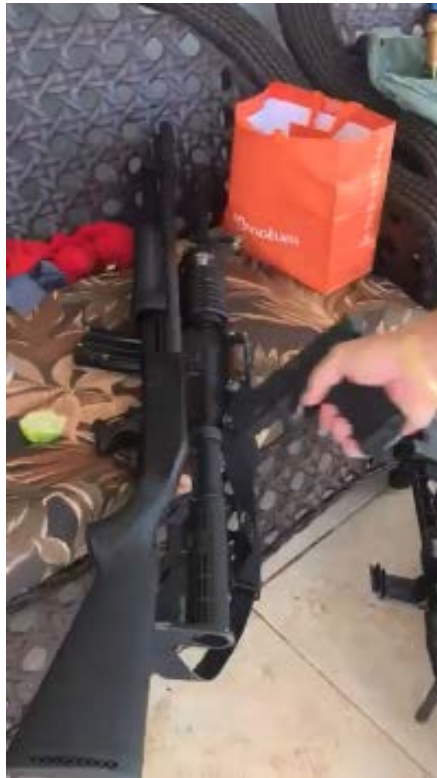
Dono de garimpo em terra indígena Munduruku exhibe arsenal em vídeo nas redes sociais.

episódio da tentativa de ingresso forçado na região do Igarapé Baunilha, na Bacia do Rio Cururu, berço de vivência da etnia Munduruku, em que invasores fortemente armados e organizados, com escolta de milicianos e apoio aéreo de helicópteros, promoveram o ingresso de maquinário pesado de garimpo na região e ameaçaram caciques, guerreiros, lideranças e mulheres indígenas que se contrapunham a tal ingresso;