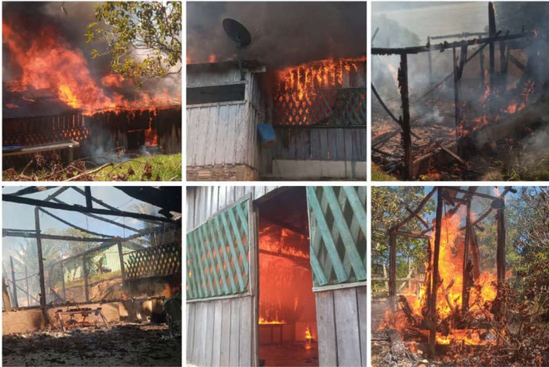
Detalhes dos incêndios

Barroso, e que os criminosos articulam novas invasões, como a que se intenta rumo à Bacia do Rio Cururu, com notória desfaçatez e poder de articulação, financiados por compradores de ouro ilegal e empresários de insumos, bens e serviços de garimpo da região de Itaituba e Jacareacanga, inclusive com influência sobre o meio político, certos de que poderão dispor livremente do produto do crime, ou seja, do ouro usurpado, arrimados no discurso espúrio da legalização da garimpagem em terra indígena como forma de purgação dos seus crimes;