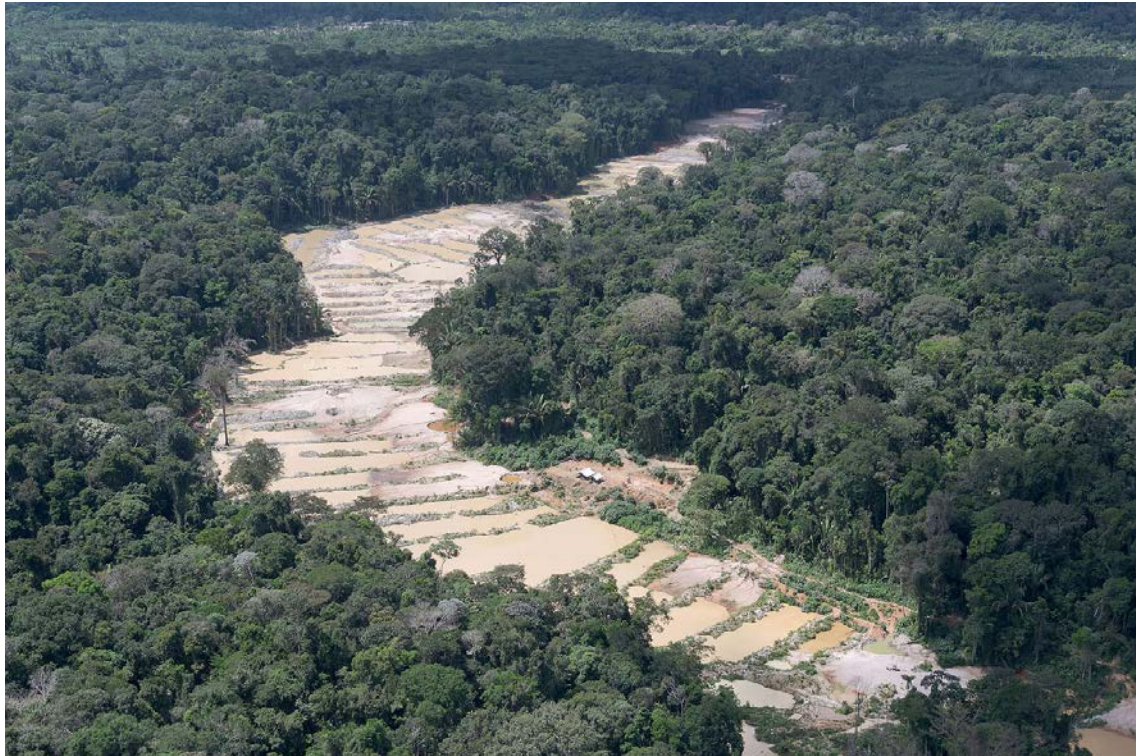
TI-Munduruku, 2020.

39. CONSIDERANDO que, em relação aos sucessivos episódios de violências, ameaças e invasões praticados por garimpeiros ilegais em terras indígenas, vigora um silêncio eloquente por parte dos principais atores e entidades representativas dos setores de aquisição de ouro de garimpo, de distribuidoras de títulos e valores mobiliários, e exportadoras, em especial a ASSOCIAÇÃO NACIONAL DO OURO – ANORO, a ASSOCIAÇÃO BRASILEIRA DE METAIS PRECIOSIS – ABRAMP e a ASSOCIAÇÃO BRASILEIRA DOS FABRICANTES DE JÓIAS DE OURO CERTIFICADO - AMAGOLD;