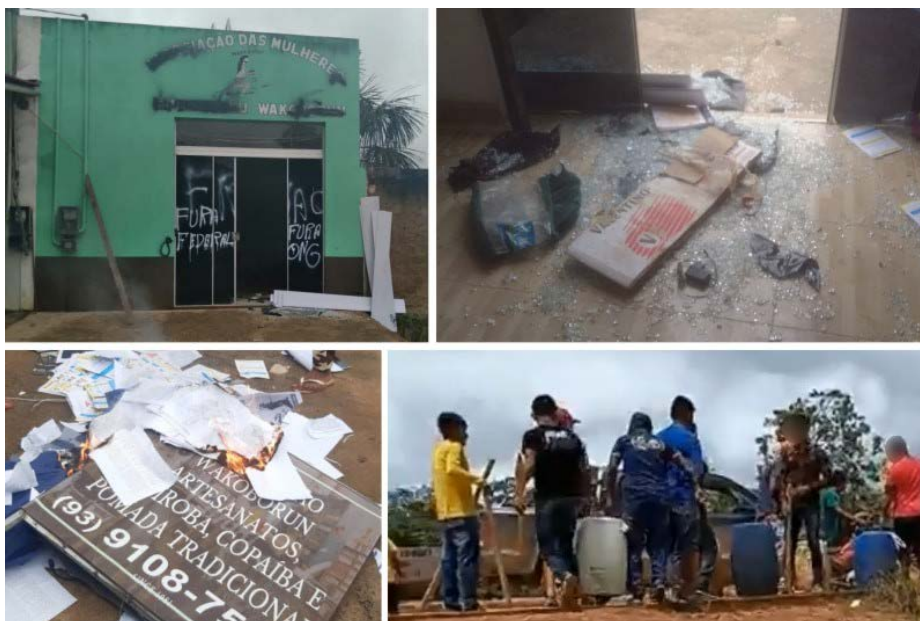
roubo de combustíveis da associação (arquivo MPF) Cenas da destruição da sede da associação Wakoborun e do roubo de combustíveis da associação (arquivo MPF)

12. CONSIDERANDO que, pela gravidade e pelo modus operandi da tentativa de ingresso forçado na região do Igarapé Baunilha, evidenciou-se a existência de grupos criminosos especializados na promoção de invasões forçadas nas terras indígenas Munduruku e Sai Cinza, com a utilização de expedientes como o aliciamento, comissionamento de indígenas (porcentistas), contratação de escolta aérea, intimidação por pessoas armadas, tudo isso com indisfarçada articulação e financiamento de compradores de ouro ilegal e fornecedores de insumos e serviços de garimpo da região de Itaituba e Jacareacanga, inclusive com influência sobre o meio político;