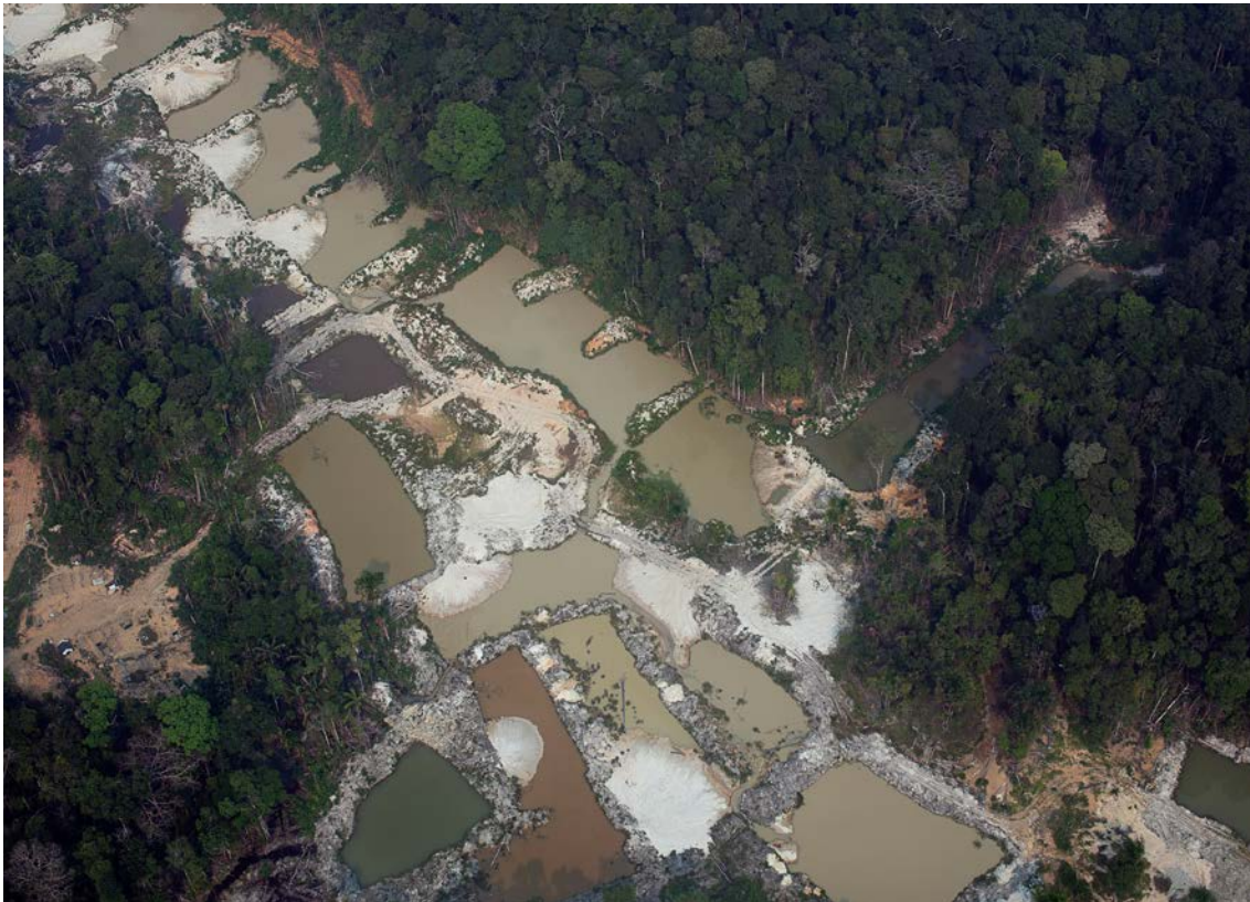
TI-Munduruku, 17/09/2020.

7, e mesmo assim mediante a autorização do Congresso Nacional e ouvidas as comunidades afetadas, ficando-lhes assegurada participação nos resultados da lavra, na forma da lei, nos termos do art. 231, §§ 3º e 7º, da CF; CONSIDERANDO, no entanto, que a garimpagem é atividade lícita, prevista na Constituição Federal, mas que o seu exercício se submete à delimitação de áreas e condições pela União e à proteção do meio ambiente, nos termos dos arts. 21, XXV, e 174, §3º, CF;