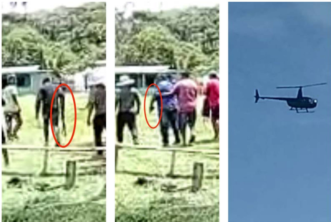
Pessoas armadas e helicóptero filmados na área

10. CONSIDERANDO que, muito embora o ordenamento jurídico não admita a garimpagem no interior de terras indígenas, é de conhecimento público o crescente processo de invasão desses territórios por grupos de criminosos que se especializam em promover a usurpação de bens minerais da União e outros crimes correlatos mediante o cometimento de ameaças e violências contra minorias, notadamente nas terras indígenas Munduruku e Sai Cinza, que têm registrado recentemente inúmeros episódios de violência;