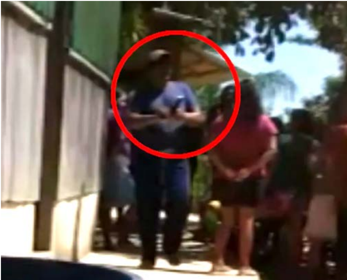
Integrante de grupo pró-garimpo foi armado à aldeia onde as casas foram incendiadas.

17. CONSIDERANDO que, a despeito das decisões proferidas pelo Excelentíssimo Senhor Ministro do Supremo Tribunal Federal, Luís Roberto Barroso, na ADPF 709, ajuizada pela APIB, no sentido da retirada dos invasores das terras indígenas Munduruku e Sai Cinza, e no âmbito de medida liminar na Ação Civil Pública 1000962-53.2020.4.01.3908, que tramita na subseção judiciária de Itaituba, também no sentido da desintração dos invasores, o Poder Executivo recusou-se a dar pleno cumprimento às decisões do Poder Judiciário mediante a negativa de apoio à operação de desintração por parte do Ministério da Defesa sob a alegação de insuficiência de recursos orçamentários;