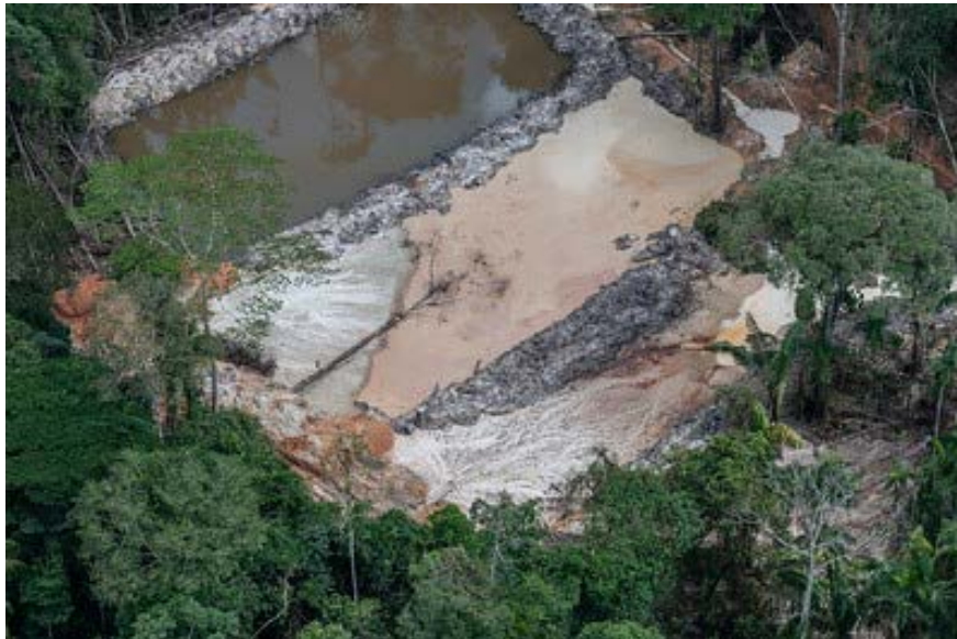
TI-Munduruku, 2018.

20. CONSIDERANDO que esses grupos de criminosos têm se autodenominado garimpeiros justamente com o propósito de suscitar falso sentimento de classe e assim enganar inadvertidamente a população local, setores da economia e mesmo representantes eleitos em prol do cometimento de crimes, da pilhagem de bens minerais da união e das violências contra a população indígena;